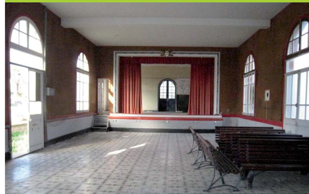
Vue actuelle de la salle de rez-de-chaussée.

Dans le cadre de cette ligne de conduite, le projet de réhabilitation de l'ancien patronage Saint-Louis a été voté par le conseil. Il deviendra un espace culturel.