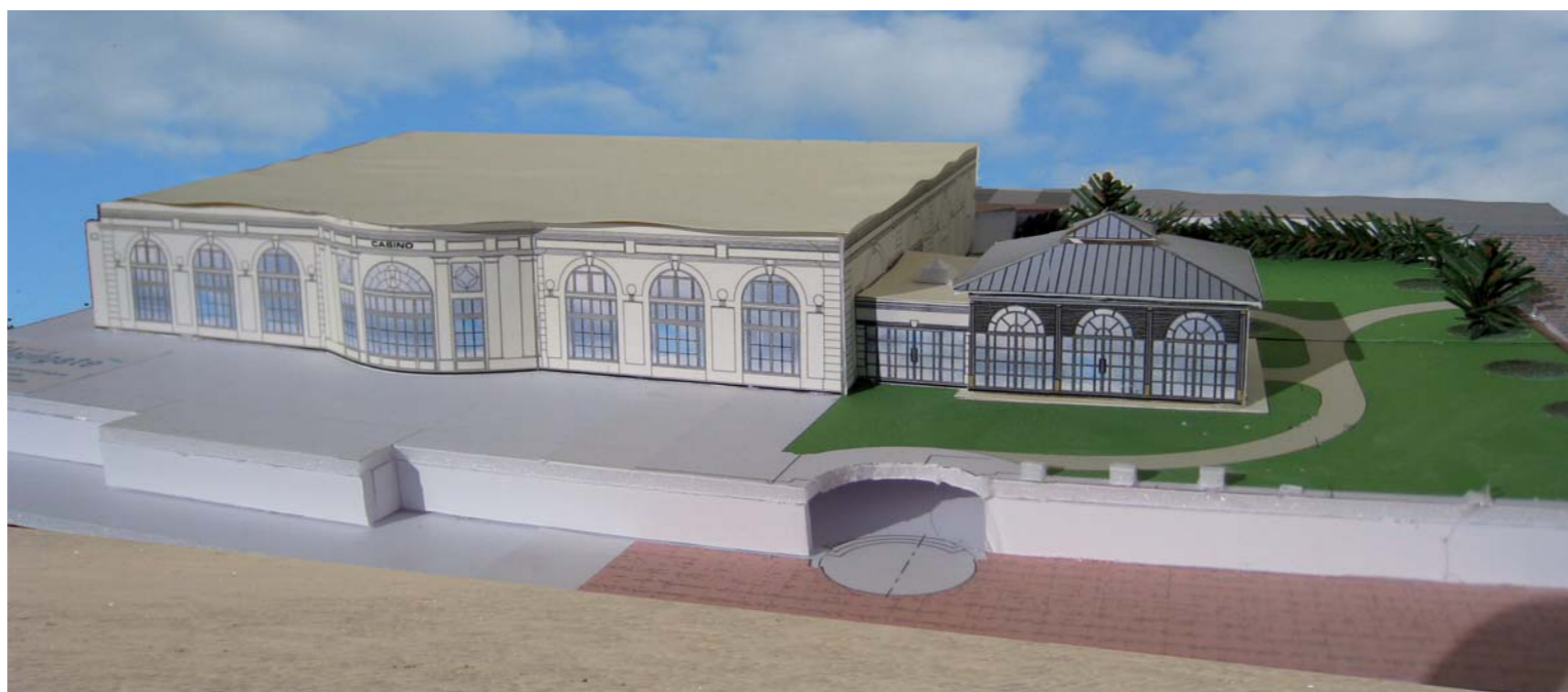
Maquette du futur aménagement des jardins du casino pris en charge par le Casino.

► Lancement du PLU et révision simplifiée du POS. Une fois le cabinet retenu courant janvier, nous formerons les différents groupes de travail nécessaires et nous mènerons à bien cette tâche de longue haleine sur 18 à 24 mois. Cette révision a pour objet de préserver le patrimoine paysager et architectural, maîtriser l'urbanisation, actualiser le règlement et limiter la hauteur des constructions en centre-ville.