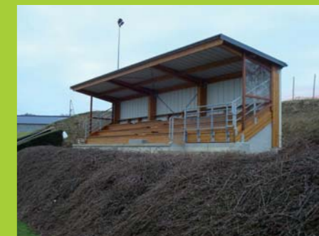
Tribune du stade

Le financement de la construction a été assuré par la municipalité pour un montant de 64 934,43 € TTC (hors chemin d'accès,