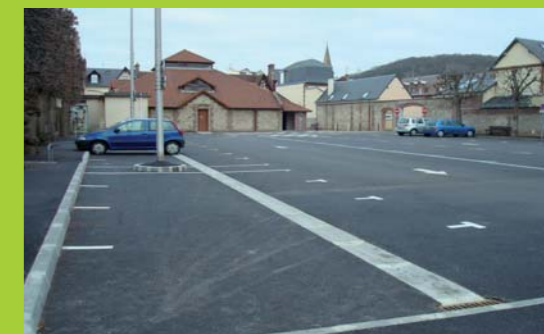
Place du Marché

Les aménagements de « Cœur de Bourg » achevés, le parking de la place du marché a été réaménagé de manière à clore les aménagements du centre-ville et utiliser au mieux ce parking (augmentation du nombre de places).